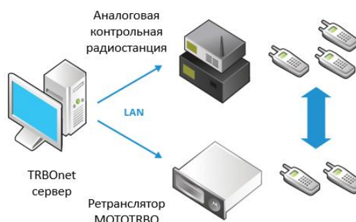
Миграция «из аналога в цифру»